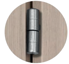
Cerniere Anuba finitura cromo